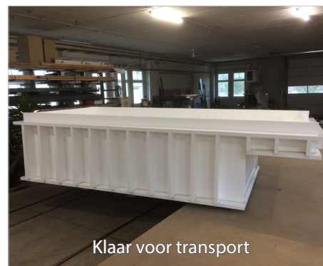
Klaar voor transport