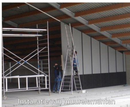
Installatie van muurelementen

In deze stal werd gekozen om verschillende kleuren in de wanden te verwerken: zwart onderaan en lichtgrijs bovenaan. Zo werd een aangename, heldere sfeer in de stal gecreëerd.